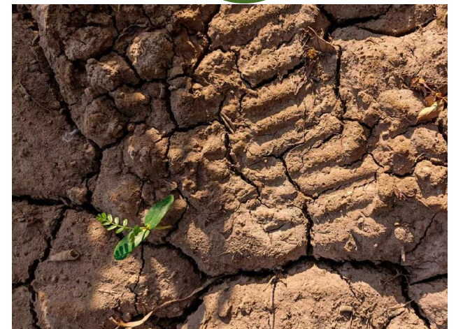
A nossa pegada e a resiliência da Natureza